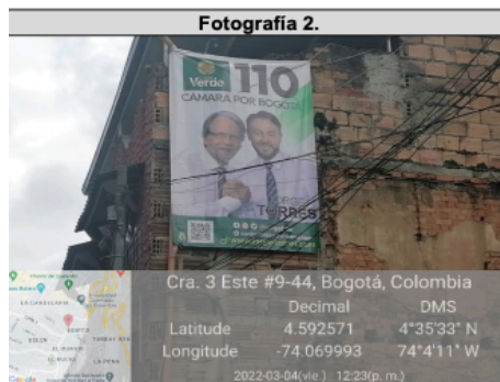
Se identifica un (1) elemento instalado en la culata del inmueble.

Así pues, al analizar el Concepto Técnico precitado, y en virtud de los hechos anteriormente narrados, esta Entidad encuentra en principio, un proceder presuntamente irregular por parte de las personas, partidos y/o movimientos enunciados anteriormente, por cuanto se encontró publicidad exterior visual, la cual infringe de manera presunta disposiciones relativas a la instalación de publicidad política electoral, la cual claramente realiza alusiones al candidato JORGE EDUARDO TORRES CAMARGO , identificado con cédula de ciudadanía No. 80022859 y al PARTIDO ALIANZA VERDE , con NIT. 800142005-8, tal como se puede observar a continuación: