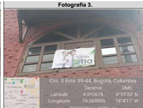
Se identifica un (1) elemento instalado en la ventana del inmueble.

Que, en cumplimiento del derecho al debido proceso y de conformidad con el artículo 18 de la Ley 1333 de 2009, esta Secretaría dispone iniciar proceso sancionatorio ambiental en contra de las siguientes personas, partidos y/o movimientos políticos: